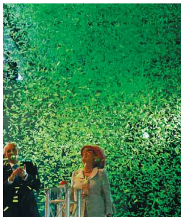
September 2007: Wageningen Campus wordt officieel geopend. Koningin Beatrix laat groene sneeuw neerdalen in Forum