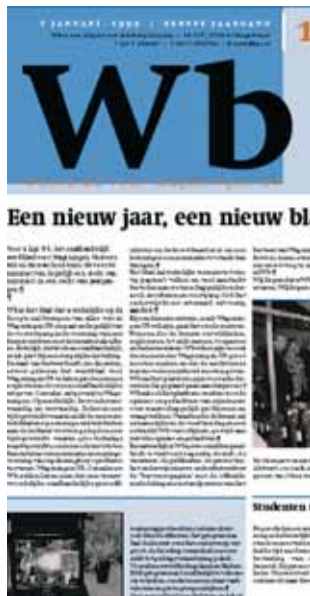
Januari 1999: Wb verschijnt, het nieuwe weekblad voor Wageningen UR.