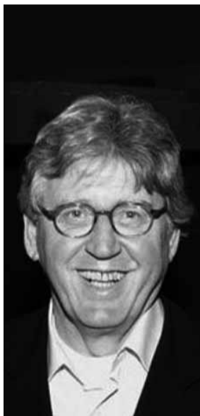
Mei 1996: Bram Peper presenteert zijn rapport Duurzame kennis, duurzame landbouw