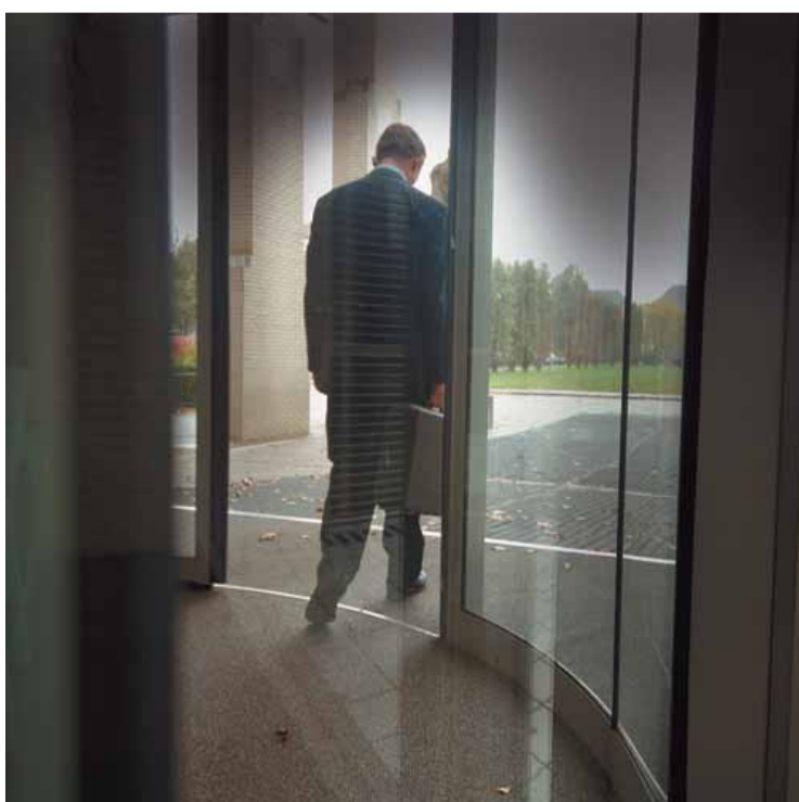
November 2005: De gevreesde brieven vallen in de bus bij medewerkers. Daarin staat of hun baan blijft bestaan of niet