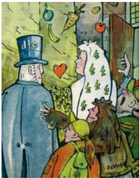
December 1996: De Tweede Kamer steunt de plannen van landbouwminister Van Aartsen (tekening HVR)