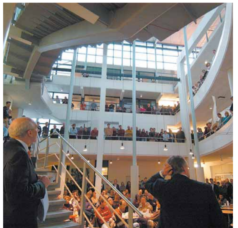
Januari 2005: Medewerkers van A&F krijgen te horen dat hun instituut grotendeels wordt ondergebracht bij de universiteit en dat een klein deel zal worden verkocht aan een externe partij