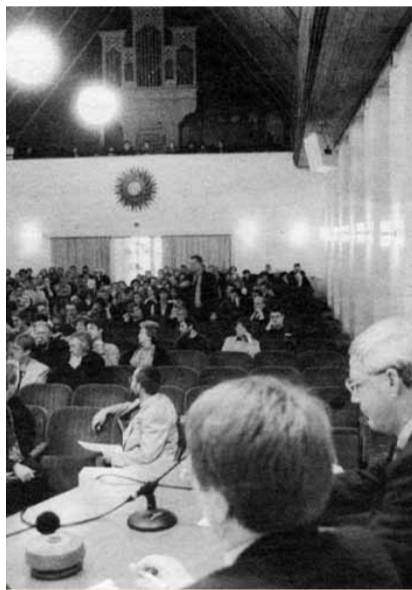
Maart 1997: De eerste voorlichtingsbijeenkomst over Kenniscentrum Wageningen in de Aula