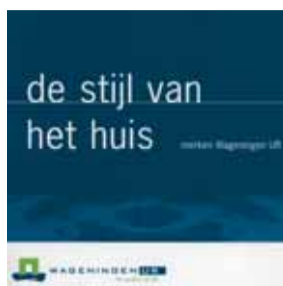
September 1999: De nieuwe huisstijl van Wageningen UR wordt gepresenteerd