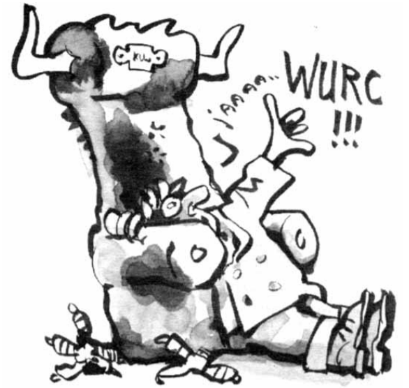
Mei 1998: KCW wordt omgedoopt tot Wageningen Universiteit en Research Centrum (tekening HvR)