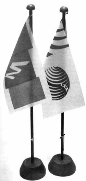
Februari 1996: Minister Van Aartsen maakt bekend dat hij samenwerking tussen LUW en DLO wil