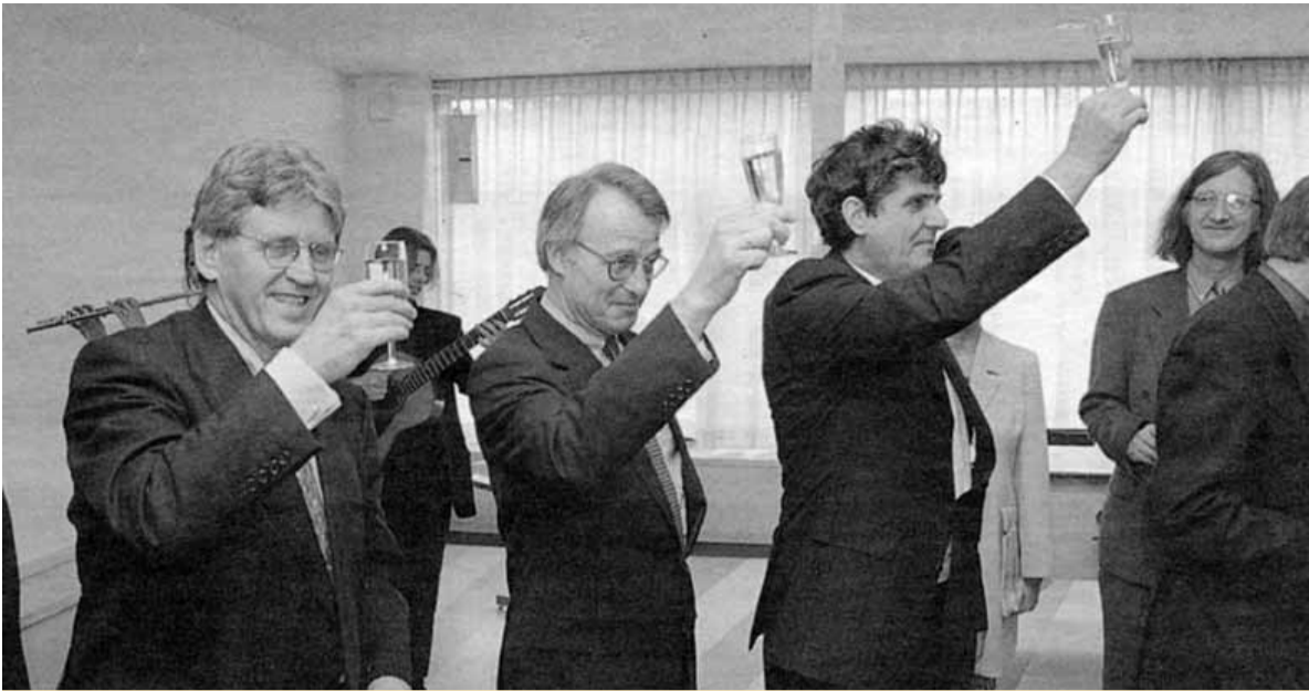
April 1998: De oprichting van Kenniscentrum Wageningen (KCW) wordt officieel beklonken